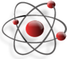
Рисунок 1 – Пример рисунка [4]

Основной текст статьи. Основной текст статьи. Основной текст статьи. Основной текст статьи. Основной текст статьи. Основной текст статьи. Основной текст статьи. Основной текст статьи [2, с. 49]. Основной текст статьи. Основной текст статьи. Основной текст статьи. Основной текст статьи. Основной текст статьи. Основной текст статьи. Основной текст статьи. Основной текст статьи. Основной